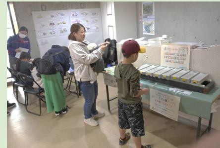
▲コン琴体験コーナーとぬりえコーナー 上手にコン琴を奏でる来場者も多く、賑やかな時間が増えました。 ぬりえも一生懸命に取り組んでくれました。