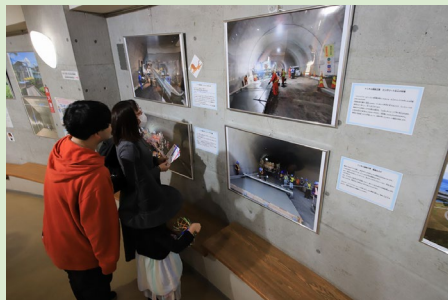
▲写真やコメントをじっくり見ながらクイズラリーを楽しんでいました。 全4種のコースをすべて制覇するお子さまもいました！