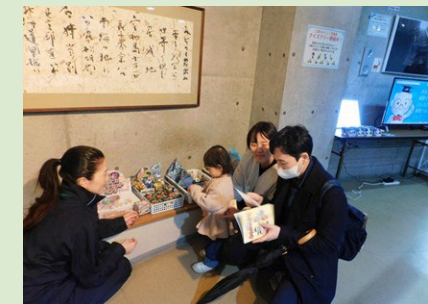
▲クイズラリーの問題は一見難しそうですが、写真やコメントを見ると簡単にわかる ように工夫しました！